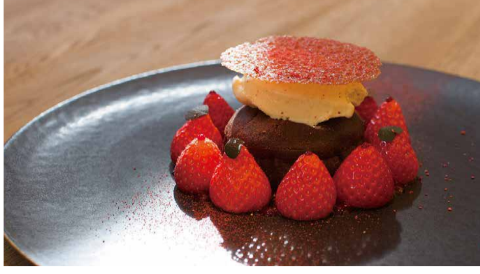
Sachinoka Strawberry From Tokushima Prefecture And Fondant Chocolate 徳島県産さちのかいちごフォンダンショコラ