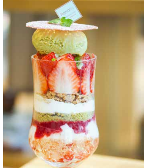
Yumenoka Strawberry From Nagasaki Prefecture And Pistachio Parfait 長崎県産ゆめのかいちごとピスタチオのパフェ