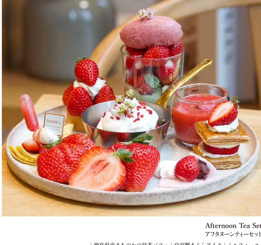
Afternoon Tea Set アフタヌーンティーセット

徳島県産さちのかの抹茶パフェ | 自家製さくらアイス | ミルフィーユ | いちごのヨーグルトショートケーキ | フレッシュいちごジュース | いちご大福 | いちごのクレープ | いちごタルト | 福岡県産あまおういちご |