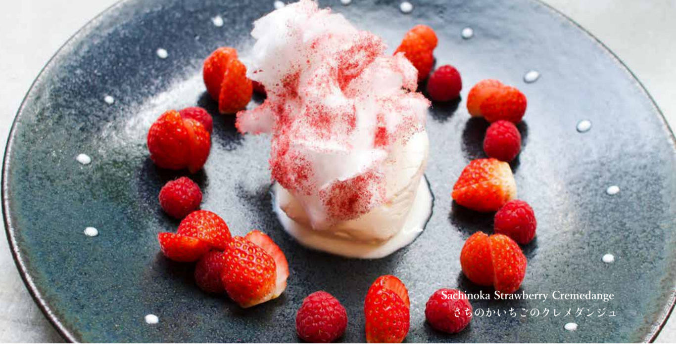
Sachinoka Strawberry Cremedange さちのかいちごのクレメダンジュ