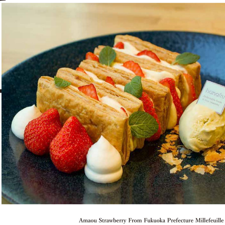
Amaou Strawberry From Fukuoka Prefecture Millefeuille 福岡県産あまおうのミルフィーユ