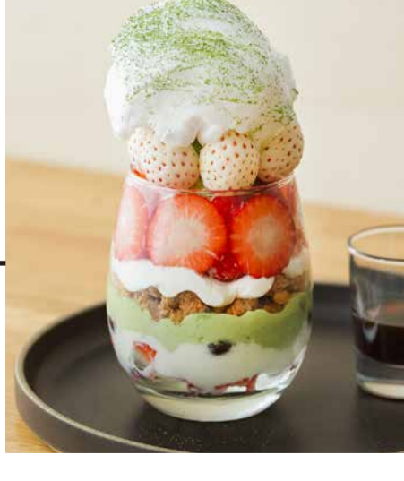
Amaou Strawberry From Fukuoka Prefecture Parfait 福岡県産あまおういちごのパフェ