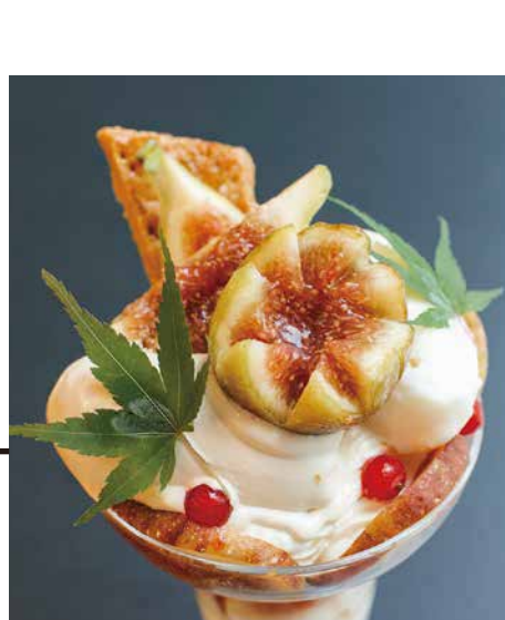
Fig Parfait 和歌山県産白いちじくと 福岡県産とよみつひめのパフェ