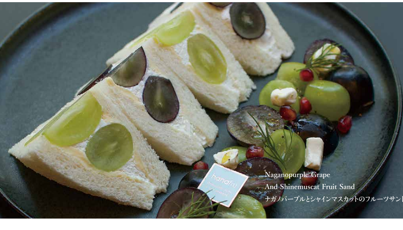
Naganopurple Grape And Shinemuscat Fruit Sand ナガノパープルとシャインマスカットのフルーツサンド