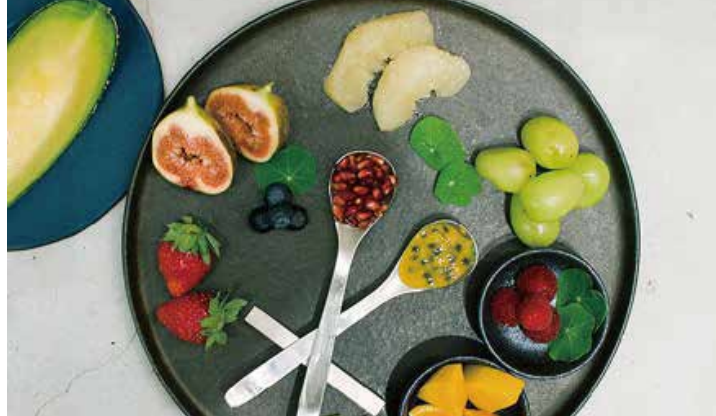
Assorted Cut Fruits カットフルーツミスト