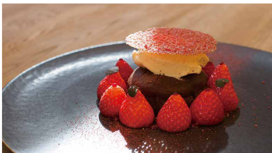
Sachinoka Strawberry From Tokushima Prefecture And Fondant Chocolate 徳島県産さちのかいちごとフォンダンショコラ