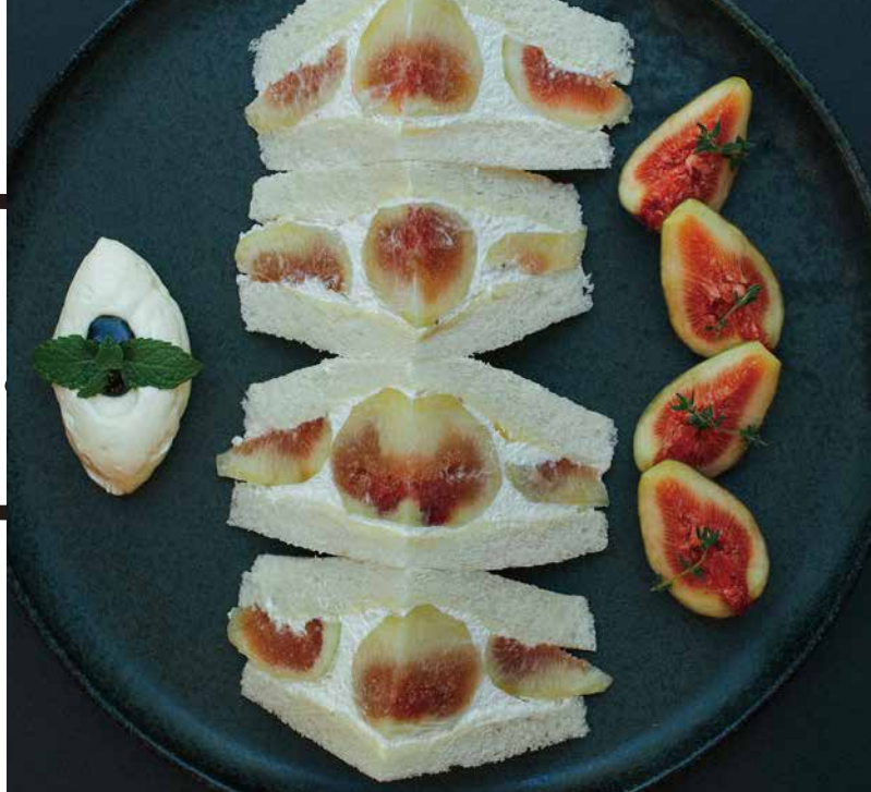
Fig Fruit Sand With Cheese Cream And Balsamic Vinegar いちじくのフルーツサンド チーズクリーム、バルサミコ酢添え