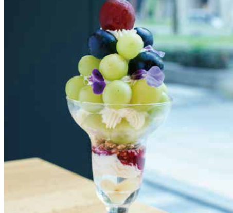
Shinemuscat Parfait シャインマスカットのパフェ