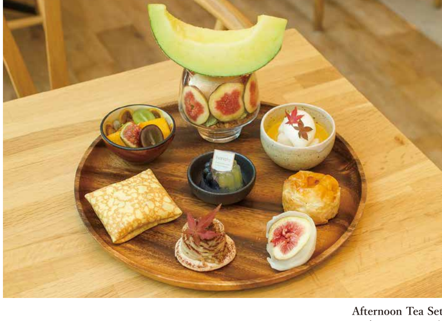
Afternoon Tea Set アフタヌーンティーセット

抹茶仕立てのメロンといちじくのパフェ | かぼちゃプリン | 岩手県産サンつがるのりんごパイ | 和栗のモンブラン | いちじく大福 | メロンクレープ | フルーツサラダ | 葡萄のジュレ |