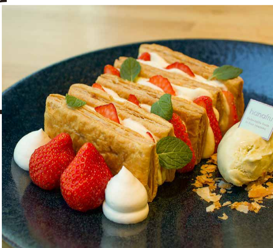
Amaou Strawberry From Fukuoka Prefecture Millefeuille 福岡県産あまおうのミルフィーユ