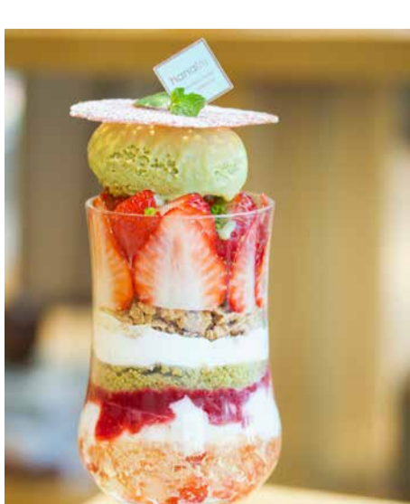
Yumenoka Strawberry From Nagasaki Prefecture And Pistachio Parfait