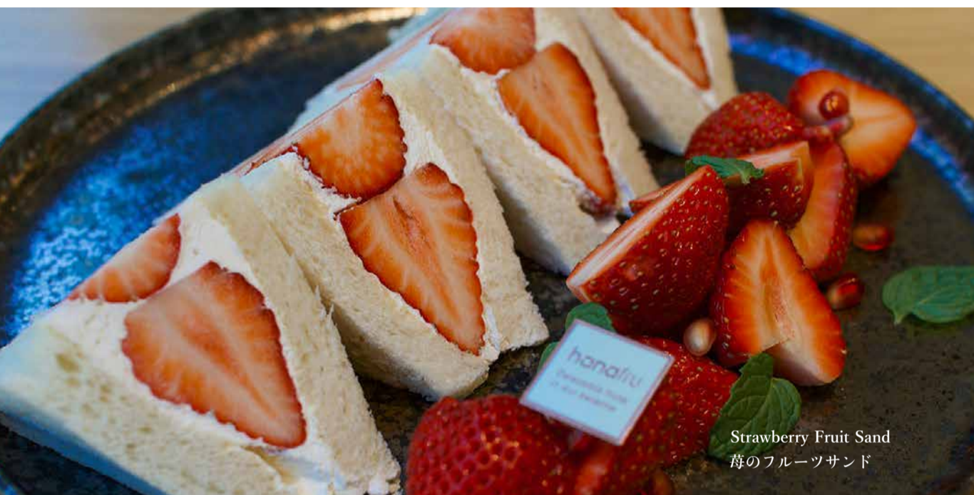
Strawberry Fruit Sand 苺のフルーツサンド