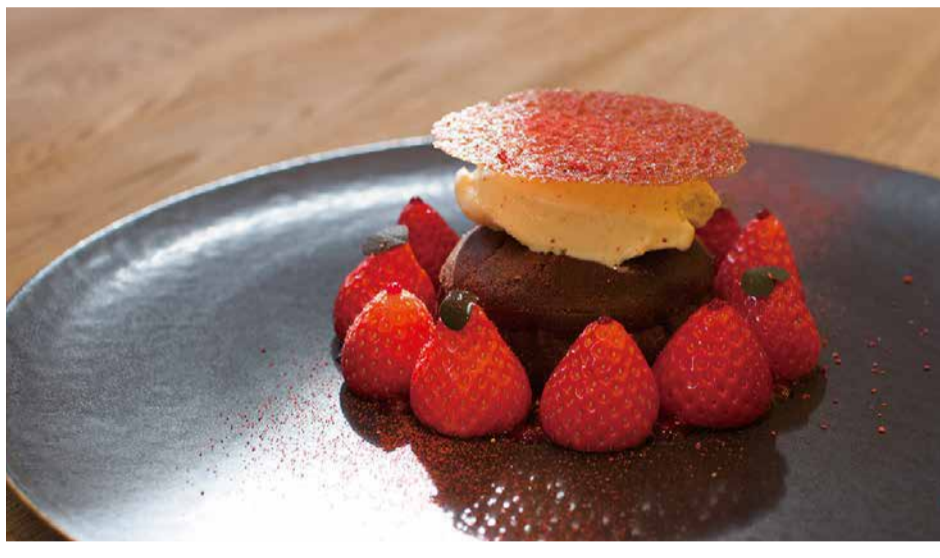
Sachinoka Strawberry From Tokushima Prefecture And Fondant Chocolate