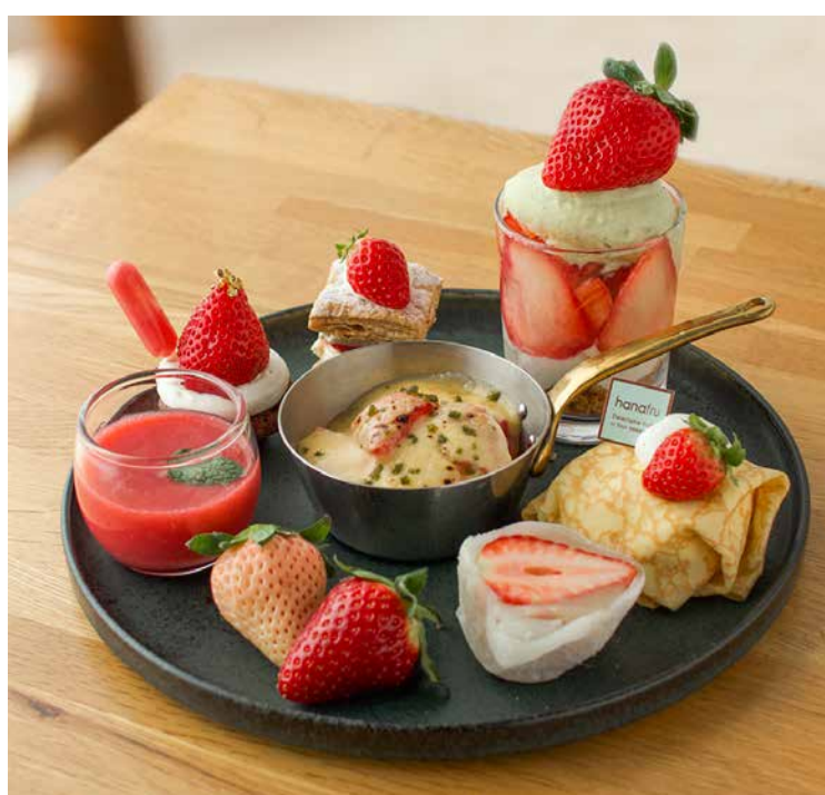
Afternoon Tea Set アフタヌーンティーセット

|いちごのミニパフェ|自家製ミントアイス|ミルフィーユ|ガトーショコラ| |フレッシュいちごジュース|いちごの食べくらべ|いちご大福|クレープ|いちごのグラタン|