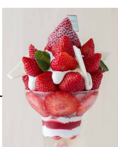
Amaou Strawberry From Fukuoka Prefecture Parfait 福岡県産あまおういちごのパフェ