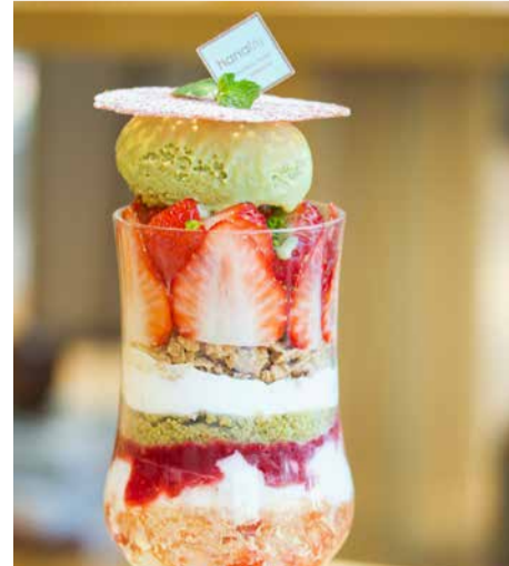
Yumenoka Strawberry From Nagasaki Prefecture And Pistachio Parfait