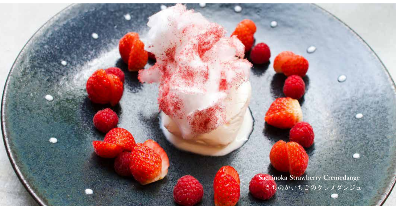
Sachinoka Strawberry Cremedange さちのかいちごのクレメダージュ