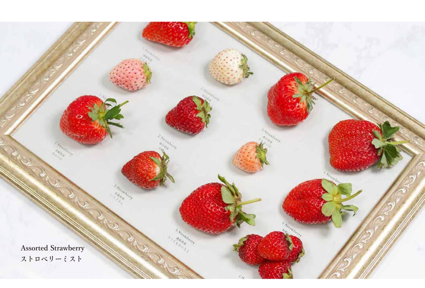
Assorted Strawberry ストロベリーミスト

With German Bread 徳島県産さちのかいちごとざくろ、ミントのサラダ ドイツパン添え