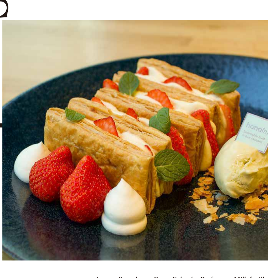
Amaou Strawberry From Fukuoka Prefecture Millefeuille