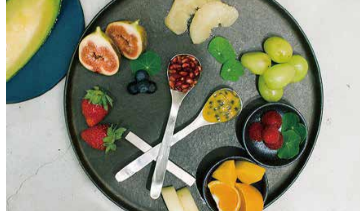
Assorted Cut Fruits カットフルーツミスト