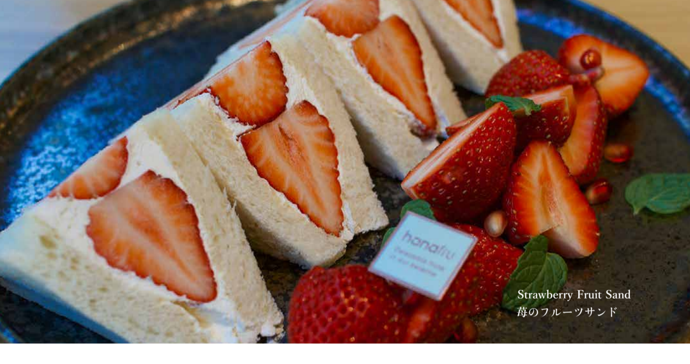
Strawberry Fruit Sand 苺のフルーツサンド