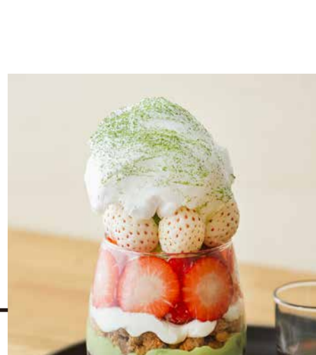
Amaou Strawberry From Fukuoka Prefecture Parfait