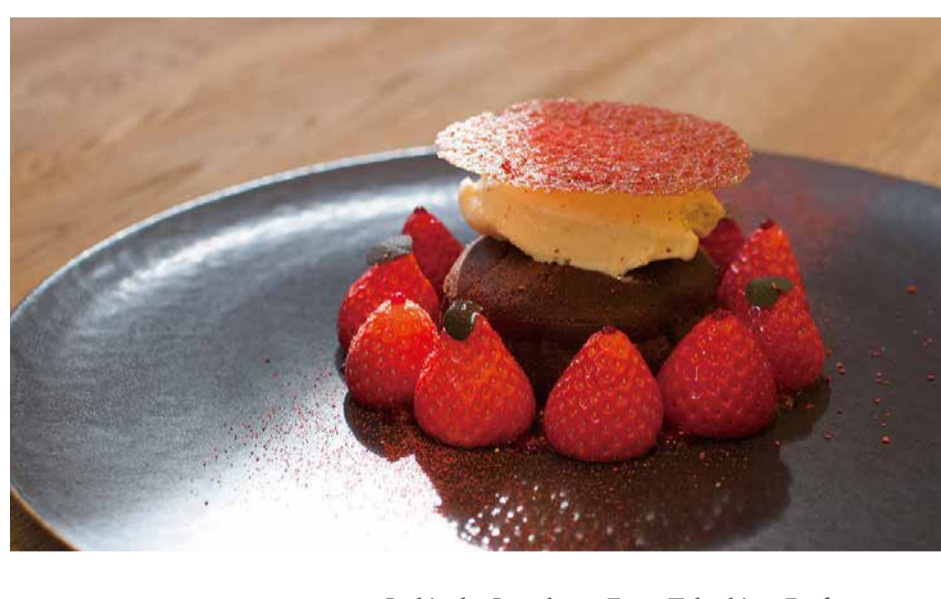
Sachinoka Strawberry From Tokushima Prefecture And Fondant Chocolate