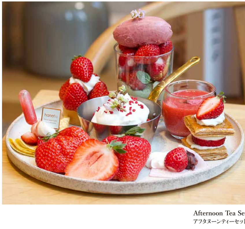
Afternoon Tea Set アフタヌーンティーセット

徳島県産さちのかの抹茶パフェ | 自家製さくらアイス | ミルフィーユ | いちごのヨーグルトショートケーキ | フレッシュいちごジュース | いちご大福 | いちごのクレープ | いちごタルト | 福岡県産あまおういちご |