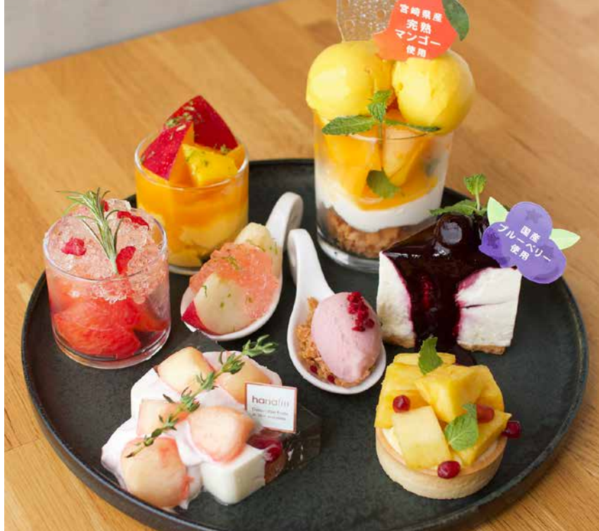
Afternoon Tea Set アフタヌーンティーセット

山梨県産一桃匠、ざくろのジュレ添え | 自家製桃アイス | 宮崎県産マンゴプリン | 宮崎県産マンゴーとココナッツプラマンジェのパフェ | ブルーベリーレアチーズケーキ | ハニーグローバインのタルト | 宮崎県産マンゴーの自家製アイス | 山梨県産すももとミルクジュレのテリーヌ | パラとヨーグルトのクリーム | 山梨県産桃のマリネ | 山梨県産大石早生のエルダージュレ |