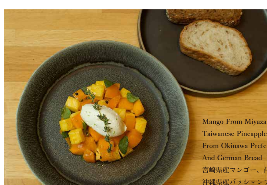
Mango From Miyazaki Prefecture, Taiwanese Pineapple, Passion Fruit From Okinawa Prefecture And Lime Salad And German Bread With Coffee or Tea 宮崎県産マンゴー、台湾産パイナップル、 沖縄県産パッションフルーツとライムのサラダ ドイツパン添え コーヒー or 紅茶付