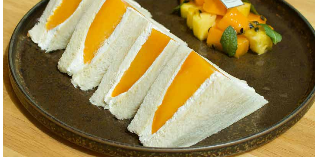
Mango From Miyazaki Prefecture Fruit Sand 宮崎県産マンゴーのフルーツサンド