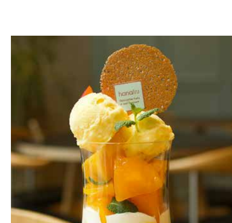
Peach From Yamanashi Prefecture Parfait 山梨県産温室桃のまるごとパフェ