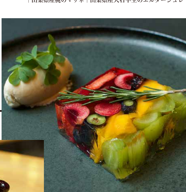
Fruit Terrine フルーツテリーヌ

山梨県産一桃匠、ざくろのジュレ添え | 自家製桃アイス | 宮崎県産マンゴプリン | 宮崎県産マンゴーとココナッツプラマンジェのパフェ | ブルーベリーレアチーズケーキ | ハニーグローバインのタルト | 宮崎県産マンゴーの自家製アイス | 山梨県産すももとミルクジュレのテリーヌ | パラとヨーグルトのクリーム | 山梨県産桃のマリネ | 山梨県産大石早生のエルダージュレ |