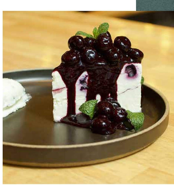
Japanese Blueberry Rare Cheesecake 国産ブルーベリーレアチーズケーキ