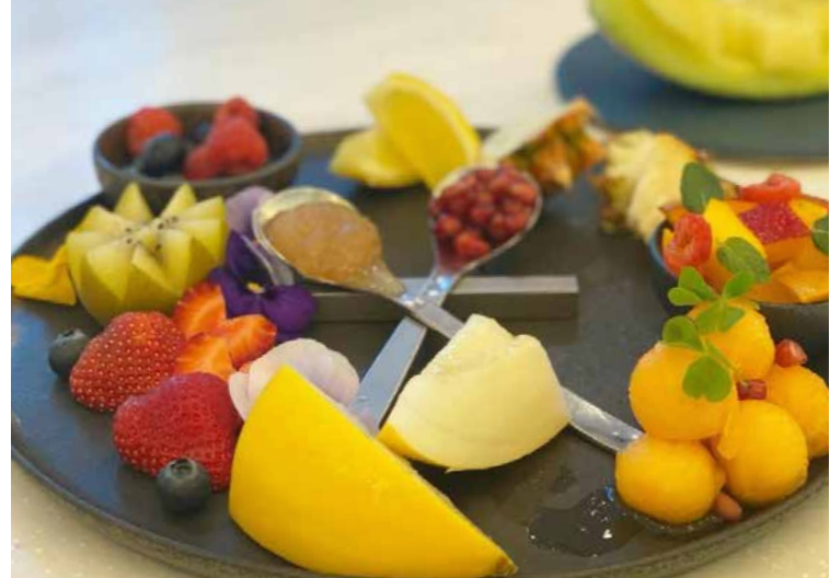
Assorted Cut Fruits カットフルーツミスト