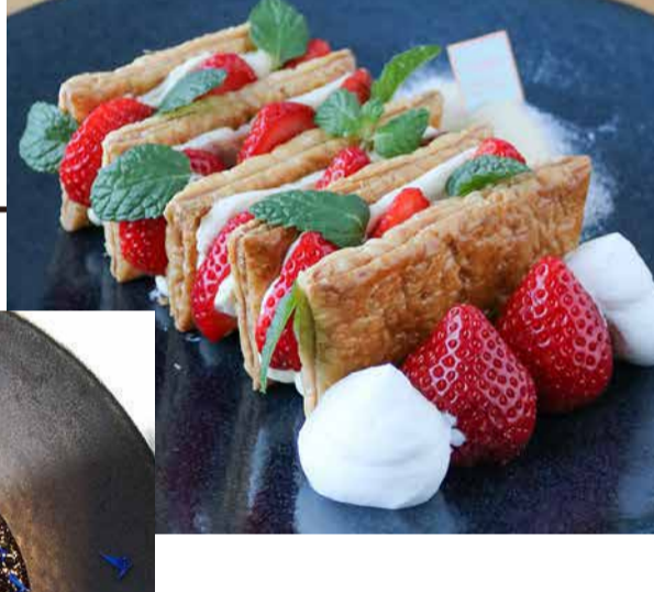
Sachinoka Strawberry From Tokushima Prefecture And Fondant Chocolate 徳島県産あまおういちごのミルフィーユ