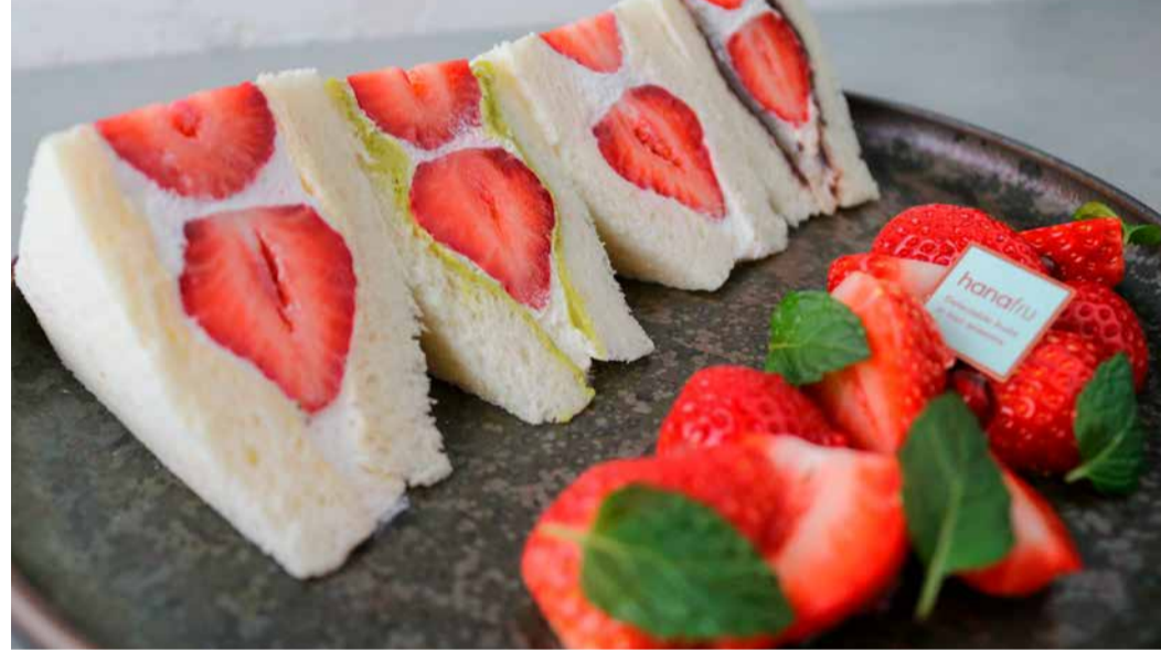
Amaou Strawberry From Fukuoka Prefecture Fruit Sandwich 福岡県産あまおうのサンドイッチ