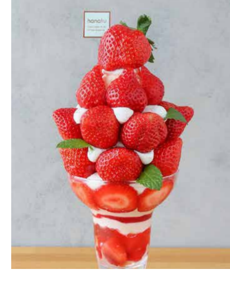
Amaou Strawberry From Fukuoka Prefecture 初物・福岡県産あまおうのパフェ