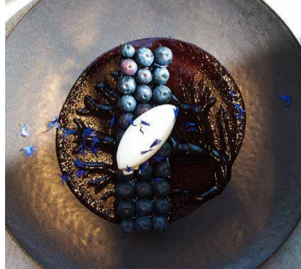
Blueberry Gateau Fromage ブルーベリーのガトーフロマージュ