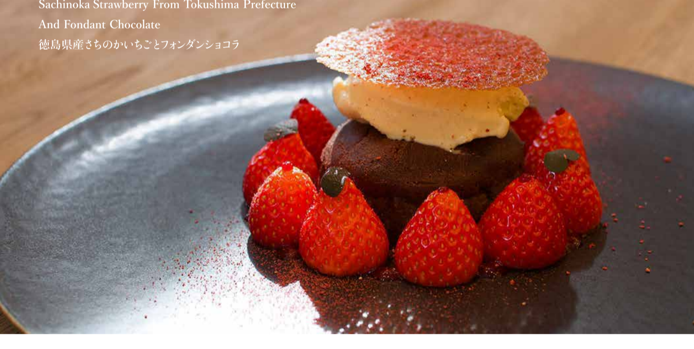
Sachinoka Strawberry From Tokushima Prefecture And Fondant Chocolate 徳島県産さちのかいちごとフォンダンショコラ