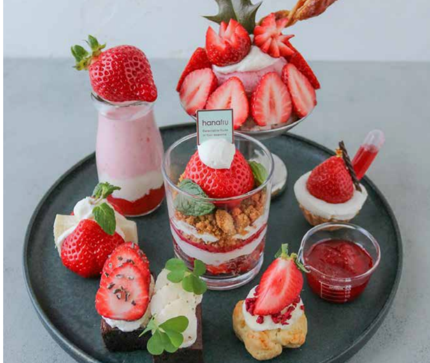
Afternoon Tea Set アフタヌーンティーセット

徳島県産さちのかいちこのサンデー、ミルクチョコフィナンシェ | 自家製いちごアイス | 徳島県産さちのかのタルト、いちごソース | 自家製いちごジャム | スコーン、クロテットクリーム | 徳島県産さちのか、奈良県産白苺のガトーショコラ | 福岡県産あまおうのフルーツサンド | 福岡県産あまおうのいちごミルク、いちごジュレ、練乳ジュレ | 福岡県産あまおうのミニパフェ |