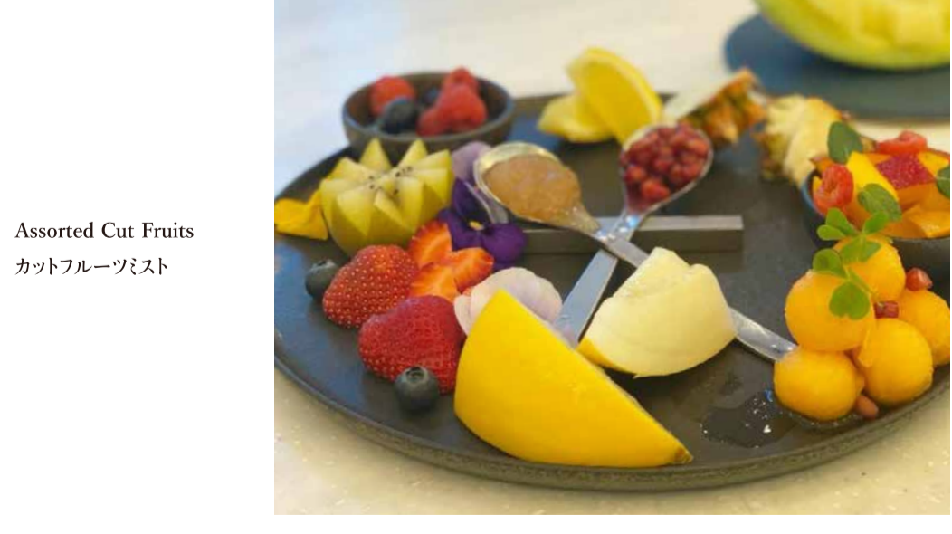
Assorted Cut Fruits カットフルーツミスト