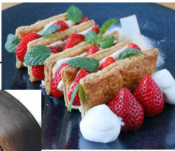
Sachinoka Strawberry From Tokushima Prefecture And Fondant Chocolate 徳島県産あまおういちごのミルフィーユ

| 徳島県産さちのかいちこのサンデー | 自家製いちごアイス | 徳島県産さちのかとピスタチオのレアチーズケーキ | | 徳島県産さちのかのガトーショコラ | いちごプリン | 自家製いちごソース | | 徳島県産ゆめのかのチョコレートディップいちご | 福岡県産あまおうのいちごミルク | | 福岡県産あまおうのミニパフェ |