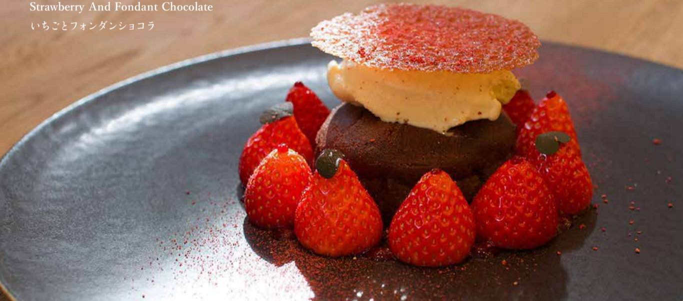
Strawberry And Fondant Chocolate いちごフォンダンショコラ