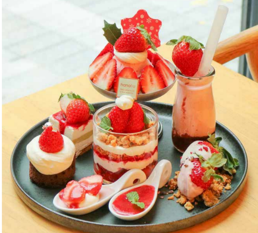
Afternoon Tea Set アフタヌーンティーセット

| 徳島県産さちのかいちこのサンデー | 自家製いちごアイス | 徳島県産さちのかとピスタチオのレアチーズケーキ | | 徳島県産さちのかのガトーショコラ | いちごプリン | 自家製いちごソース | | 徳島県産ゆめのかのチョコレートディップいちご | 福岡県産あまおうのいちごミルク | | 福岡県産あまおうのミニパフェ |