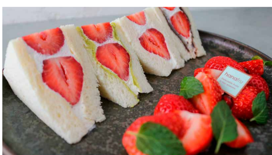
Amaou Strawberry From Fukuoka Prefecture Fruit Sandwich 福岡県産あまおうのサンドイッチ