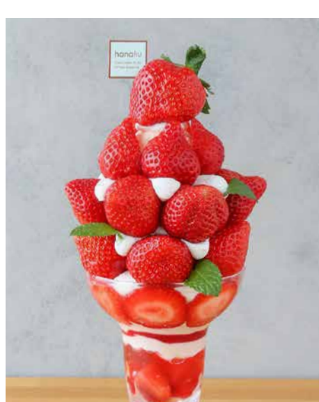
Amaou Strawberry From Fukuoka Prefecture 福岡県産あまおうのパフェ