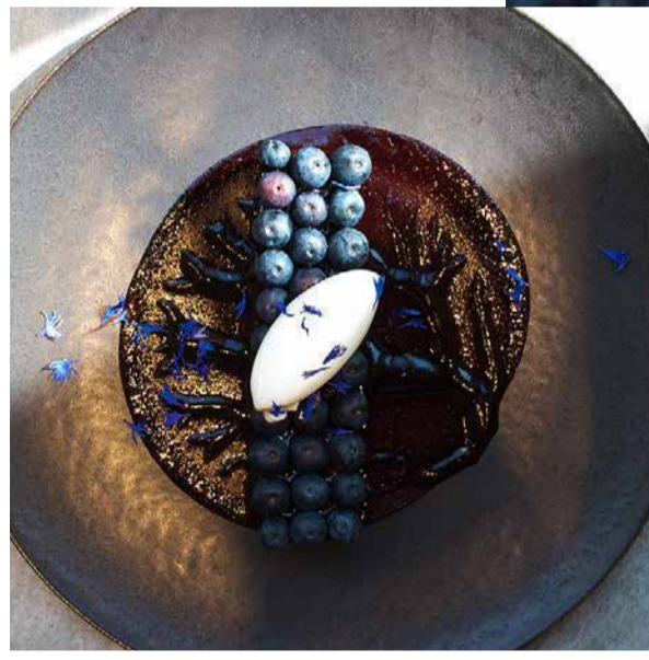
Blueberry Gateau Fromage ブルーベリーのガトーフロマージュ