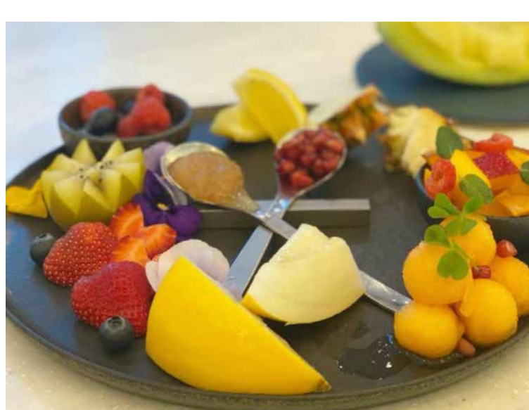
Assorted Cut Fruits カットフルーツミスト