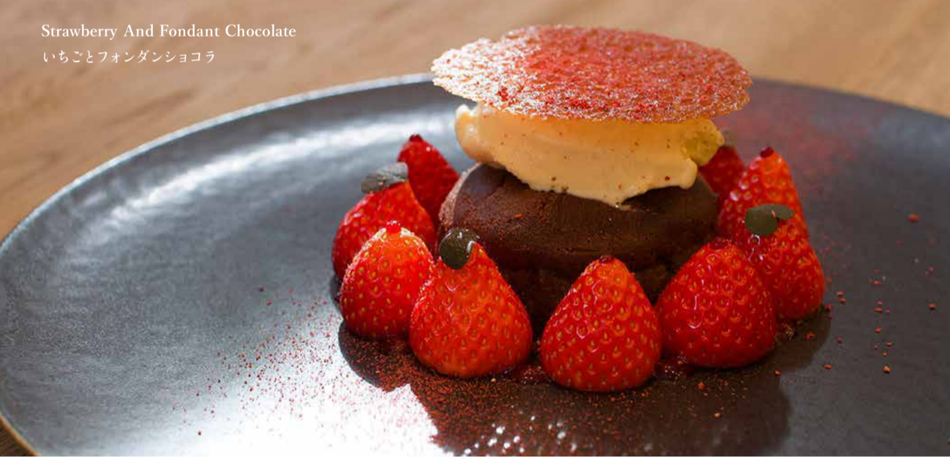
Strawberry And Fondant Chocolate いちごとフォンダンショコラ