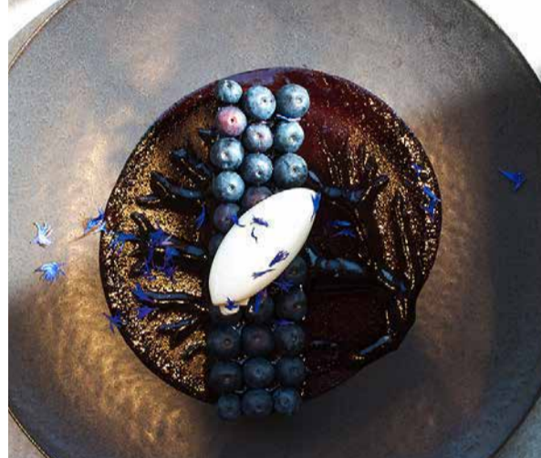
Blueberry Gateau Fromage ブルーベリーのガトーフロマージュ