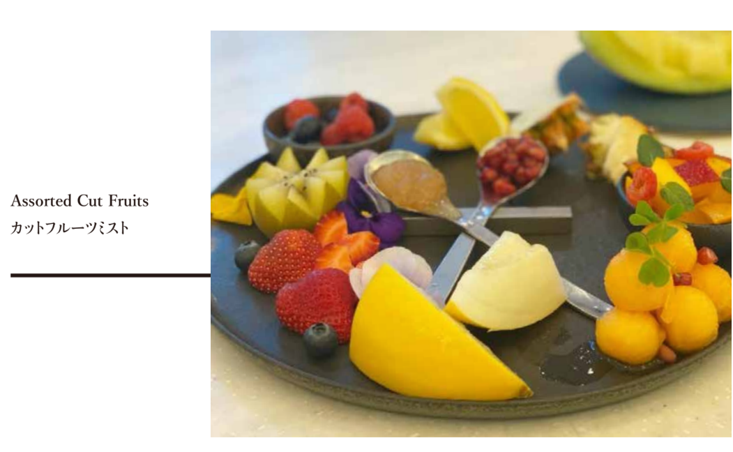
Assorted Cut Fruits カットフルーツミスト