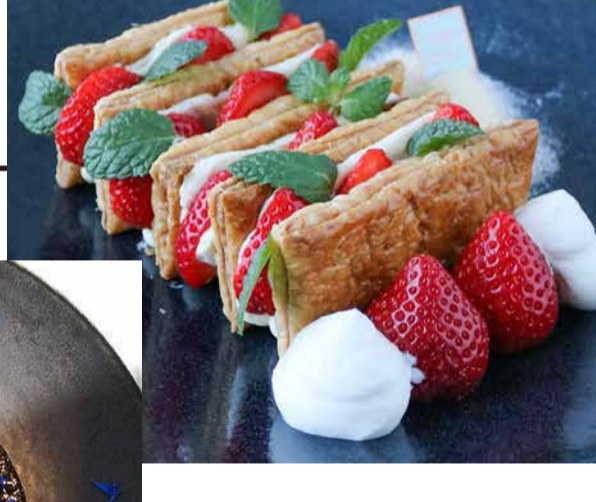
Amaou Strawberry From Fukuoka Prefecture Millefeuille 福岡県産あまおういちごのミルフィーユ