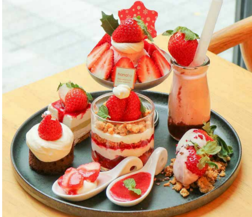
Afternoon Tea Set アフタヌーンティーセット

| 徳島県産さちのかいちこのサンデー | 自家製いちごアイス | 徳島県産さちのかとピスタチオのレアチーズケーキ | | 徳島県産さちのかのガトーショコラ | いちごプリン | 自家製いちごソース | | 徳島県産ゆめのかのチョコレートディップいちご | 福岡県産あまおうのいちごミルク | | 福岡県産あまおうのミニパフェ |