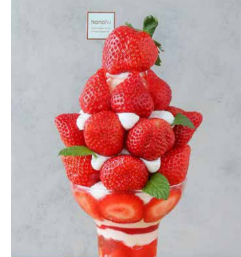
Amaou Strawberry From Fukuoka Prefecture Parfait 福岡県産あまおうのパフェ