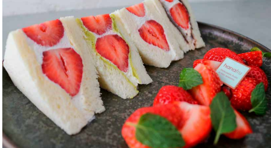
Amaou Strawberry From Fukuoka Prefecture Fruit Sandwich 福岡県産あまおういちごの4種類のフルーツサンド