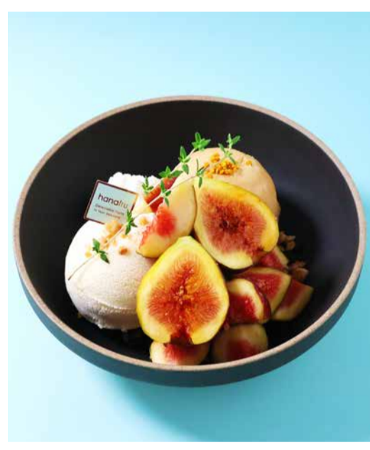
Fig Parfait いちじくのパフェ