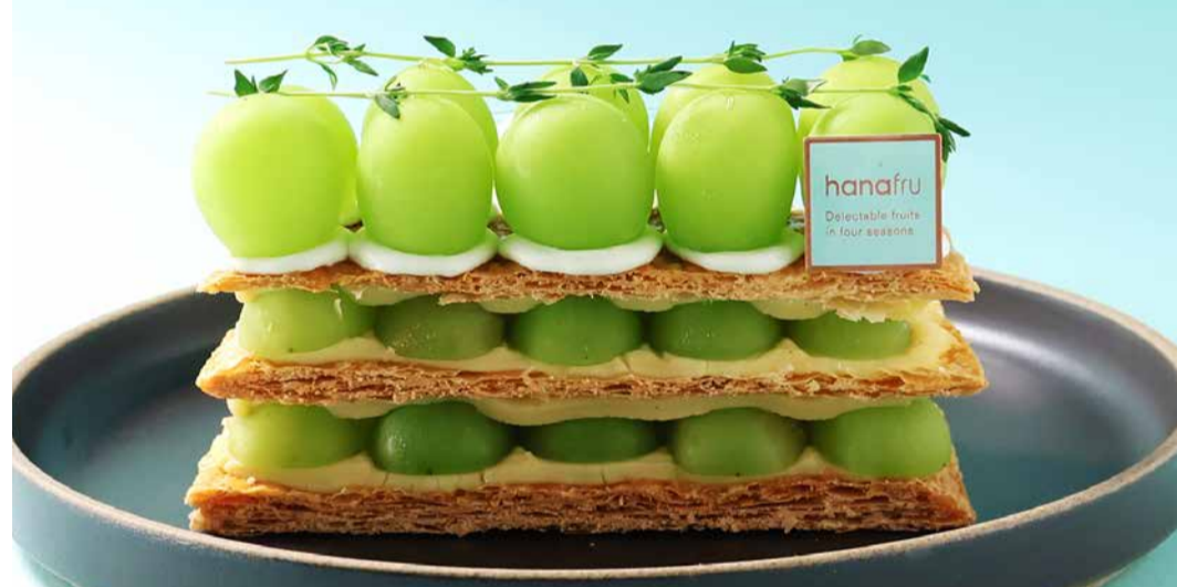
Shine Muscat Millefeuille シャインマスカットのミルフィーユ