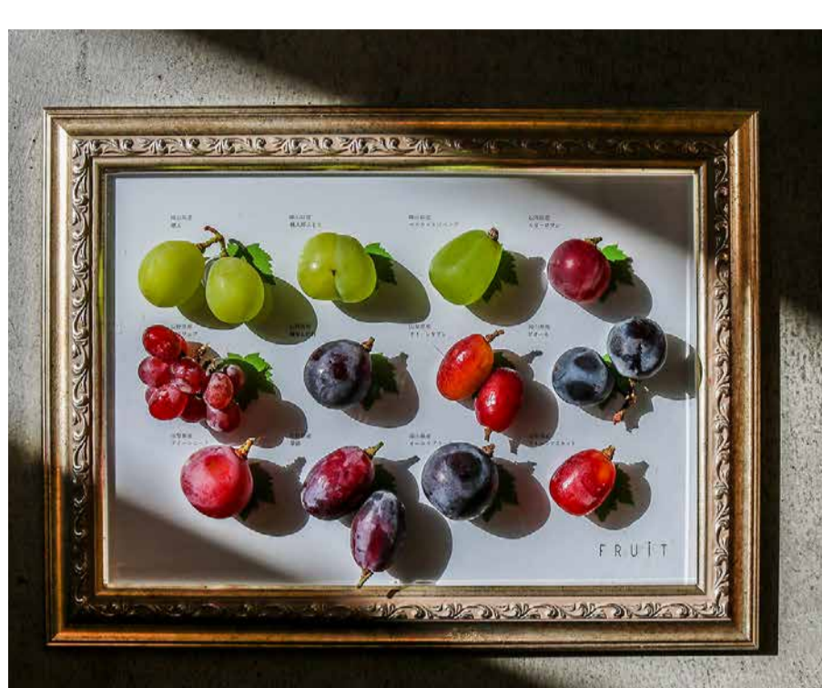
Grape Tasting Set ぶどう食べ比べセット

|いちじくのタルト|ピオーネのパフェ|いちじくのコンポート|いちじくとチャイクリームのロールケーキ| |ピオーネのムース|シャインマスカットのマカロン|ピオーネのカヌレ|シャインマスカットのバターサンド|