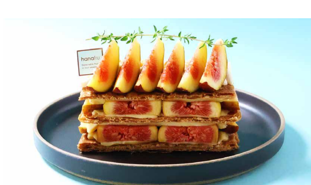
Fig Millefeuille いちじくのミルフィーユ