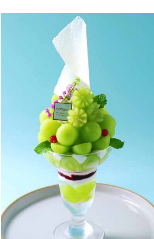
Peach Parfait 桃のまるごとパフェ