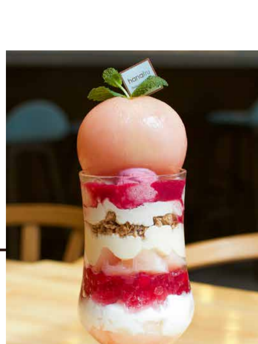
Golden Peach Parfait 黄金桃のまるごとパフェ