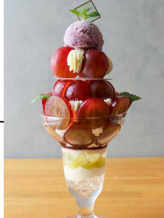
Shine Muscat Parfait シャインマスカットのパフェ