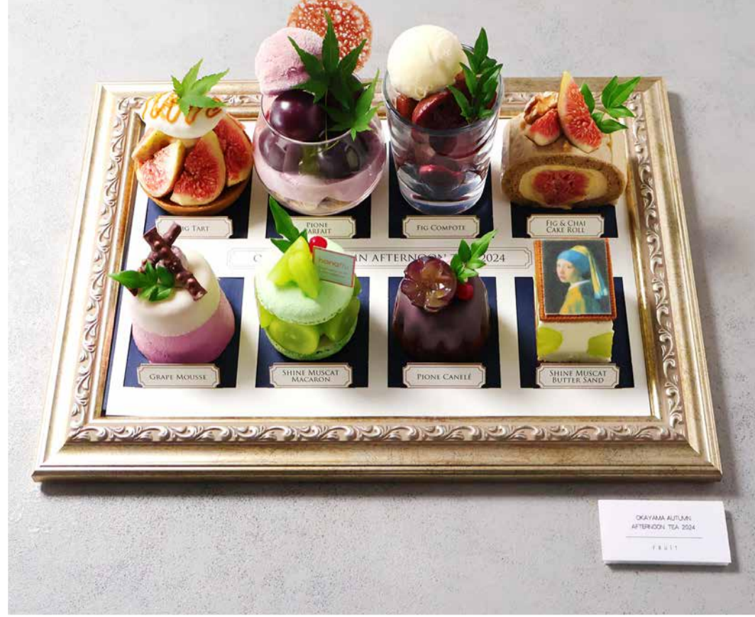
Okayama Autumn Afternoon Tea Set アフタヌーンティーセット

季節のフルーツを使用しておりますので、入荷状況により 料理内容は変更になることがあります。予めご了承ください。