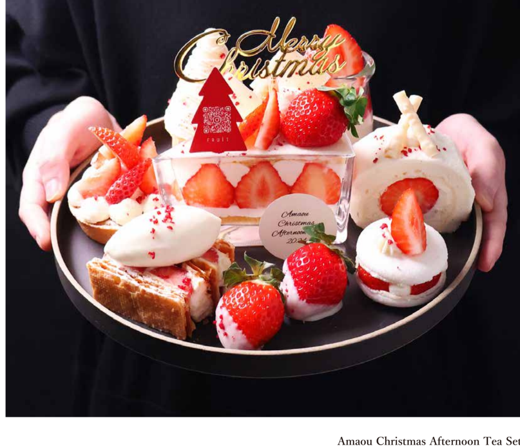
Amaou Christmas Afternoon Tea Set アフタヌーンティーセット

季節のフルーツを使用しておりますので、入荷状況により 料理内容は変更になることがあります。予めご了承ください。