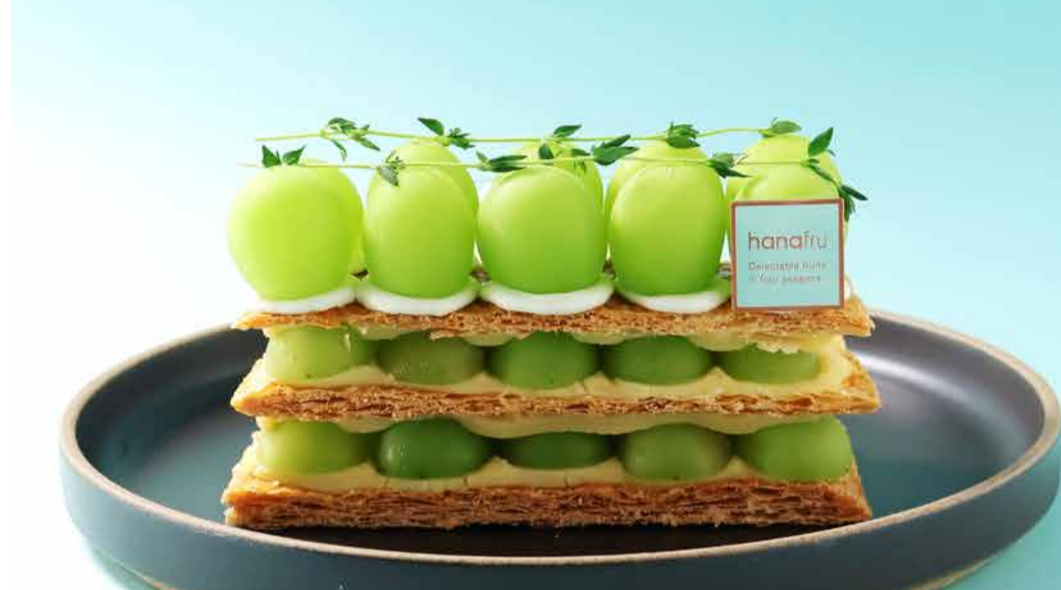
Shine Muscat Millefeuille シャインマスカットのミルフィーユ