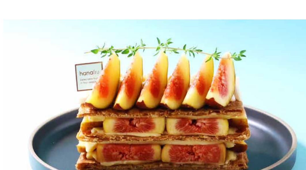
Fig Millefeuille いちじくのミルフィーユ