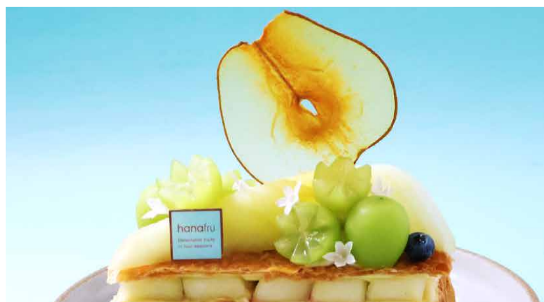
La France Pear From Yamagata And Shine Muscat Millefeuille 山形県産ラフランスとシャインマスカットのミルフィーユ