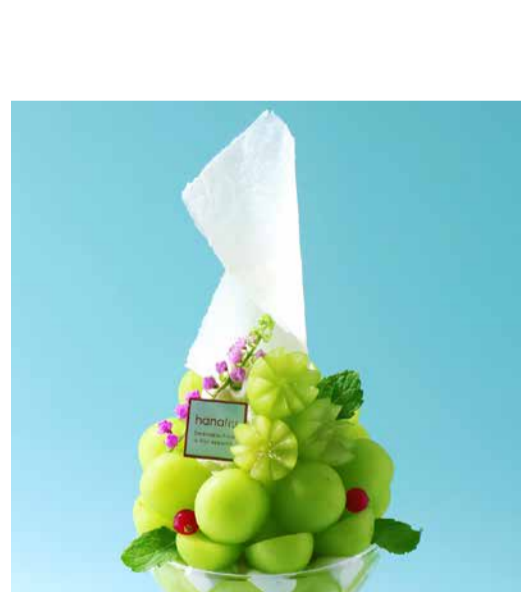
La France Pear From Yamagata