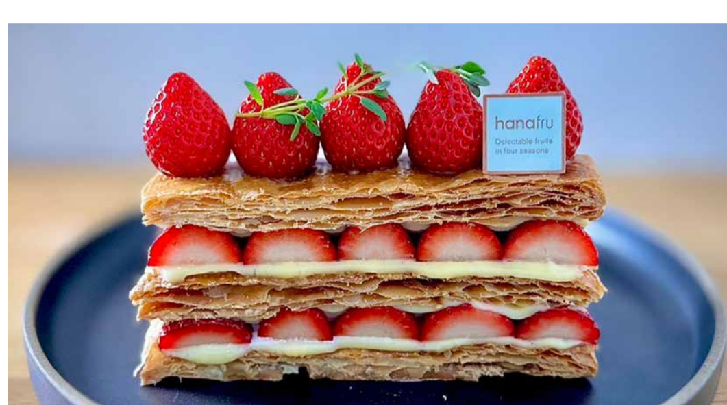
Amaou Strawberry Millefeuille あまおうのミルフィーユ

「あまおうのチョコデック」「あまおうのミルフィーユ」「あまおうマカロン」「いちごスタチオのツリームース」 「あまおうの白いロールケーキ」「あまおうのタルト」「あまおうのミルクプリン」「いちごのショートケーキパフェ」